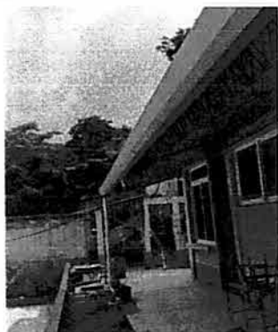
Foto 3: Reposición de Canales de Metal y sus respectivas Bajadas de agua.