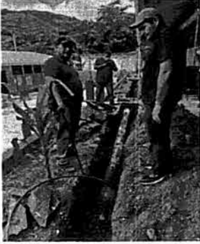
Foto1: Reparación de drenaje mal colocado.