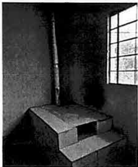
Foto1: Reparación de estufa y accesorios.