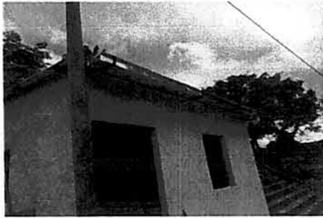
Foto 3: Reposición de canales en cocina y sus respectivas bajadas de agua.

Observación: Si es necesario se pueden agregar hojas adicionales y actualizar el número de hojas.